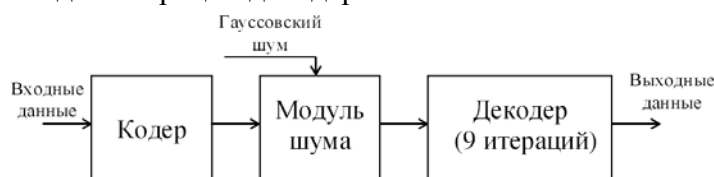
Рис. 3. Схема ПЛИС

В данной ПЛИС реализован кодер, модуль генератора гауссовского шума и декодер, состоящий из 9-ти итераций коррекции ошибок (рис.3). Разрядность шины данных 8 бит, частота следования данных 40 МГц (общая информационная скорость до 320 Мбит/сек). Длина каждой итерации декодера составляет 256 бит.